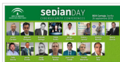
Sedian Day se celebrará el 26 de septiembre

SANDETEL, como ente instrumental de dicha Consejería, participa en el diseño, la organización y gestión de SEDIANDay. El equipo de SANDETEL cuenta con una línea específica de actuación en materia de comunicación y sensibilización de ciberseguridad que apoya el desarrollo del evento.